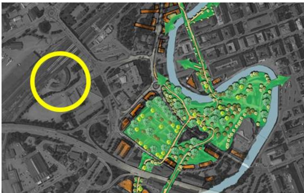
Vändskivan i relation till den framtida Viskans park

En ny scen för populärmusik i Vändskivan kan bli ett fantastiskt tillskott till Borås innerstad. En verksamhet som tillsammans med övrig utveckling runt resecentrum visar upp en levande miljö med ett brett kulturliv för den anländande besökaren.