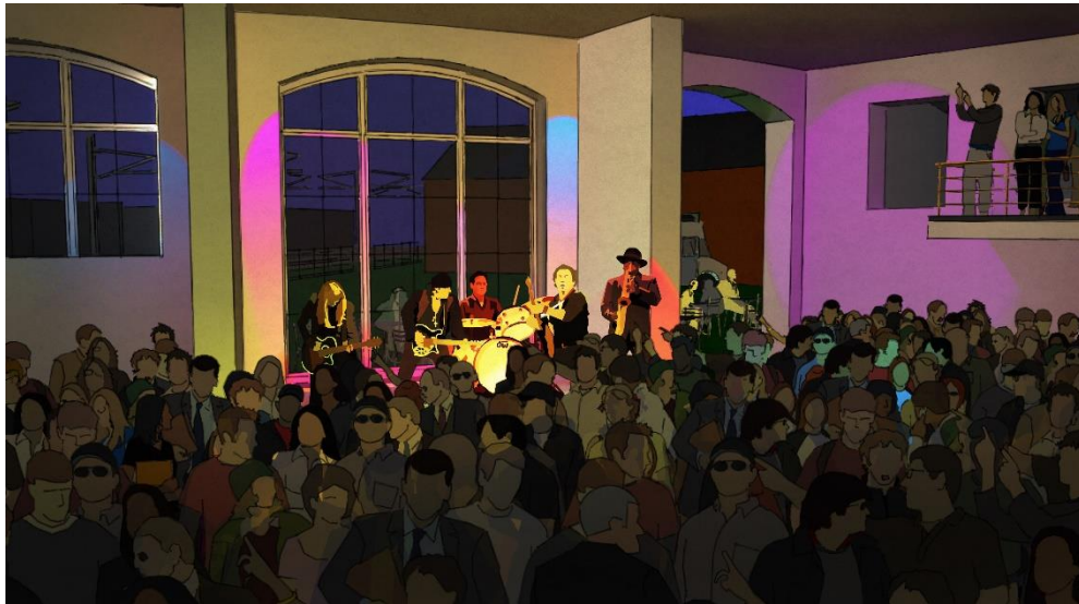
Vändskivan interiör, visualisering

Läget vid resecentrum och bredvid det nya rättscentrum ger också möjlighet att skapa en levande miljö kvällstid samt variation för både besökare och de som arbetar och verkar i det nya kvarteret. I samband med utvecklingen av miljön runt kan skapandet av en musikscen och kulturverksamhet vara ett effektivt sätt att bryta upp en miljö som annars riskerar att bli stängd och livlös när ordinarie verksamhet är stängd.